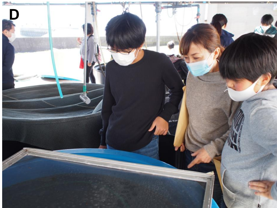
A-D:施設見学会の様子。 A, B: 小型実習船「からぬす丸」についての説明風景。 C, D: 水槽施設とそこで飼育されている実験生物を見学する参加者。