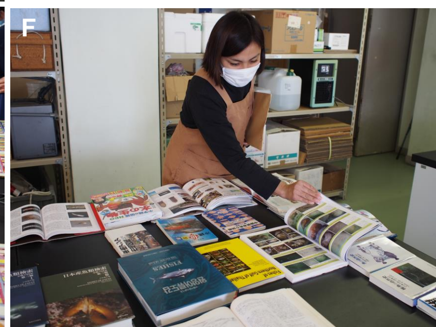
A-F: 講義終了後に実験室で行われた、標本の観察体験。A-C: 深海生物 (例: ダイオウグソクムシ=写真C) などのホルマリン標本を観察する参加者。D, E: ちりめんの中の小さな生物 (通称: チリメンモンスター) を顕微鏡を使って観察する参加者。F: 観察会のために準備された資料。